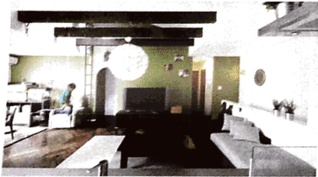
KURASUの提案する「暮らしを楽しむ家づくり」

スを活かし、カフェ「KURASSO」 をオープンさせた。同社の家づく りが体現された居心地のいい空間 で、ヘルシーなランチやドリンク、 雑貨を提供しており、フラワール レンジやヨガなどのレッスンも開 催している。これまでの「住」に加 え「衣・食」も含めた「ライフスタ イル」そのものを提案するスペー スだ。